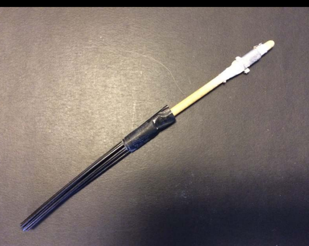
To tidlige eksempler på hjemmebyggede køller til stykket.

Pads: Små dæmperpads gav samme effekt som skumgummifyldet med tørheden, men her var differentieringen stadig god.