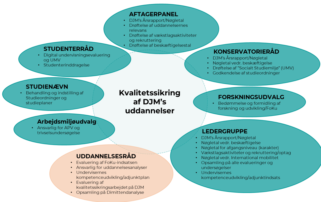
Figur: DJM's organers primære roller ift. kvalitetssikringen af DJM's uddannelser

DJMs kvalitetsorganisation afspejles i den generelle organisering, men dog har Uddannelsesrådet den overordnede rolle for kvalitetsarbejdet, hvilket fremgår af nedenstående figur