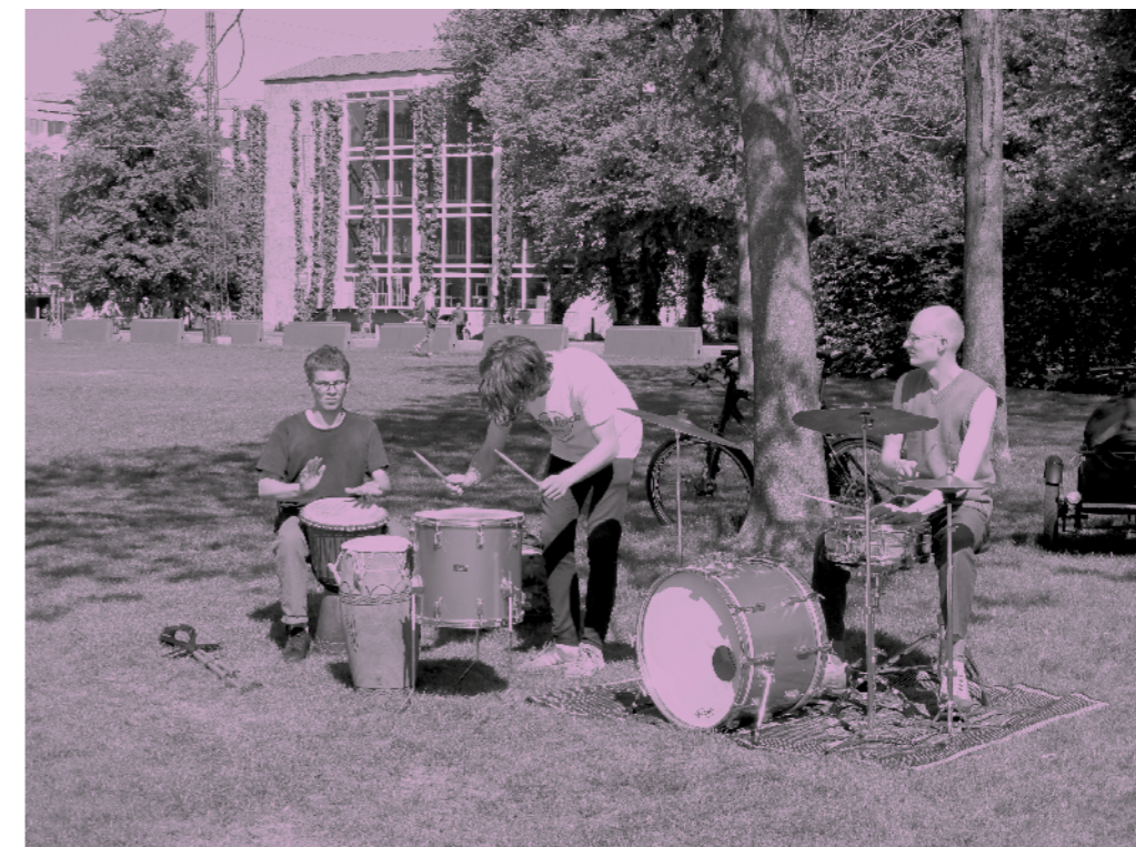
Trommetrioen 'Energidrikken' fra valgfaget Musik og Sundhed