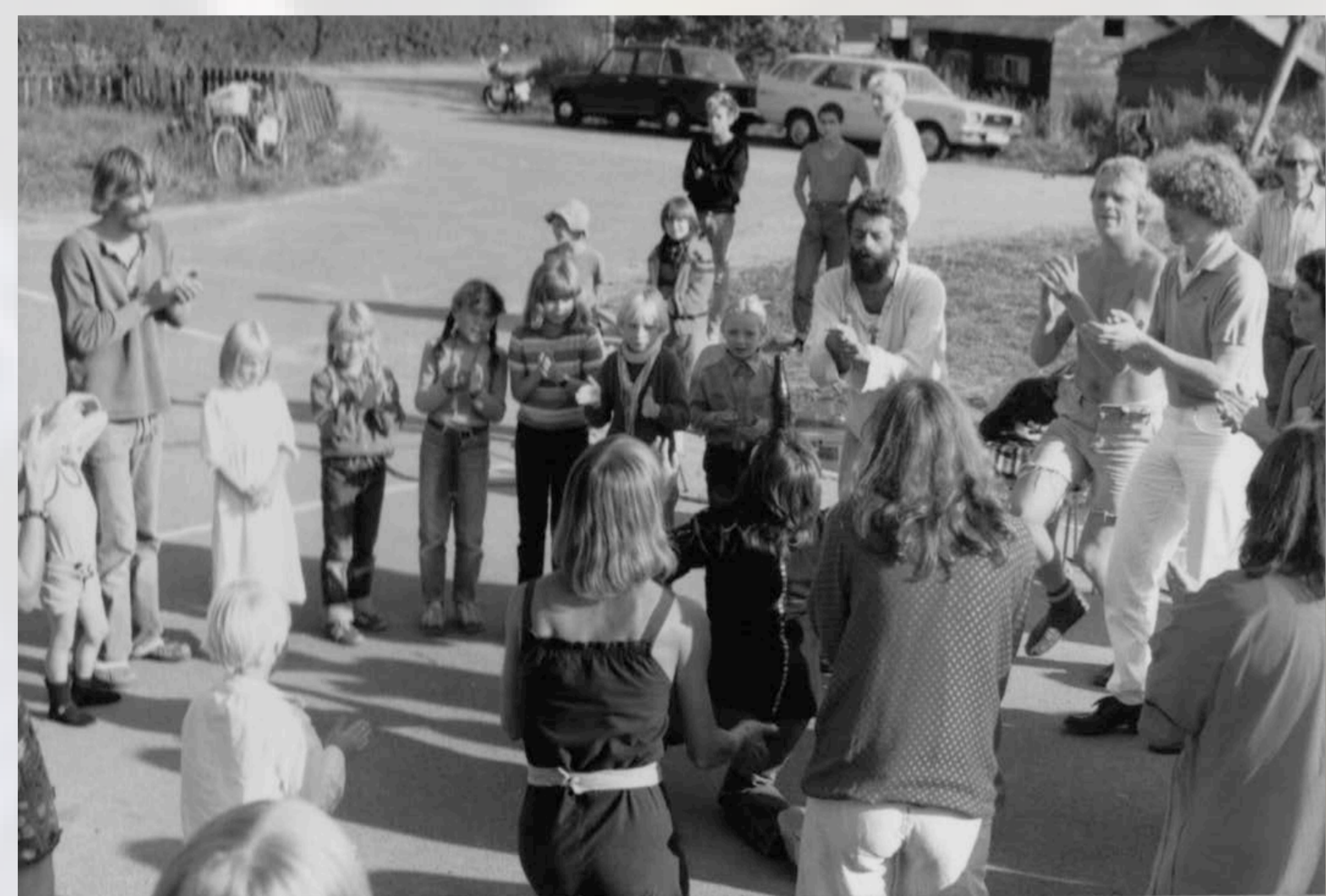
Fællesdansen "Dosala" danses i skolegården på Århus Friskole.

Musikkulturen omkring Århus Friskole har over en periode fra 1970'erne til i dag slået sig fast som et særligt musik- og bevægelsepædagogisk kraftfelt i Århusområdet og i øvrigt ydet et betydeligt bidrag til dansk musikliv. En væsentlig del af indholdet i denne musikkultur er de originale sange og sanglege, som både lærere og elever har udviklet i tidens løb. Sanglegene er overleveret mundtligt gennem flere generationer men kun i begrænset omfang dokumenteret skriftligt. Det er derfor vigtigt at sikre denne kulturarv og gøre den tilgængelig for musikundervisningen i Danmark.