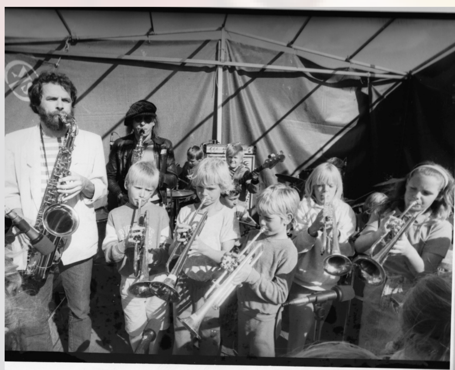
Friskolen har altid haft tradition for en stor trompetsektion.

Sanglegene med noder og forklaringer indgår i et kompendium sammen med information om deres oprindelse og pædagogiske og musikalske kvaliteter. Videoer af sanglegene vil desuden være tilgængelige på projektets hjemmeside. Materialet vil være et væsentligt bidrag til musik og bevægelsesundervisningen med fokus på sammenhængskraften mellem sang, dans og musik og vil have relevans for alle der arbejder med musikalske aktiviteter for børn: Pædagog- og læreruddannelser, musikkonservatorier, musikskoler, skoler, børnehaver m.v.