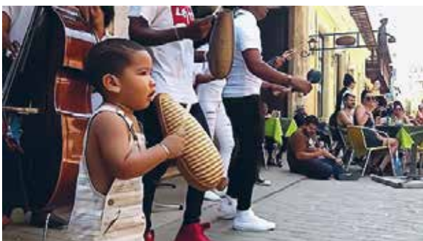
En cubansk dreng spiller og danser rumba

” Evalueringen viste en positiv aha-oplevelse og værdsættelse af den uformelle musikaktivitet, men understregede også vigtigheden af at italesætte de manglende rammer