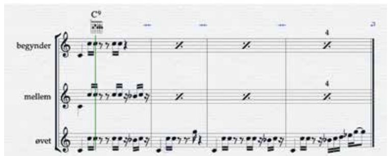
Eksempel på instrumentrolle (guitar) i 3. sværhedsgrader

Ugen efter stod de studerende selv for undervisningen, hvor de fokuserede på at understøtte flow-triggers bedst muligt. I deres valgte materiale, henholdsvis "Lazy Song" og "Stand by Me", arbejdede de således med at skabe den rette balance mellem udfordring og kompetence ved at tilpasse instrumentroller og niveauer samt ved at anvende andre elementer som fx klang og groove som param-